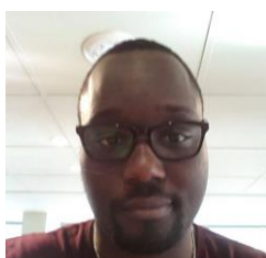
Umarao MANE Communication – Partenariat