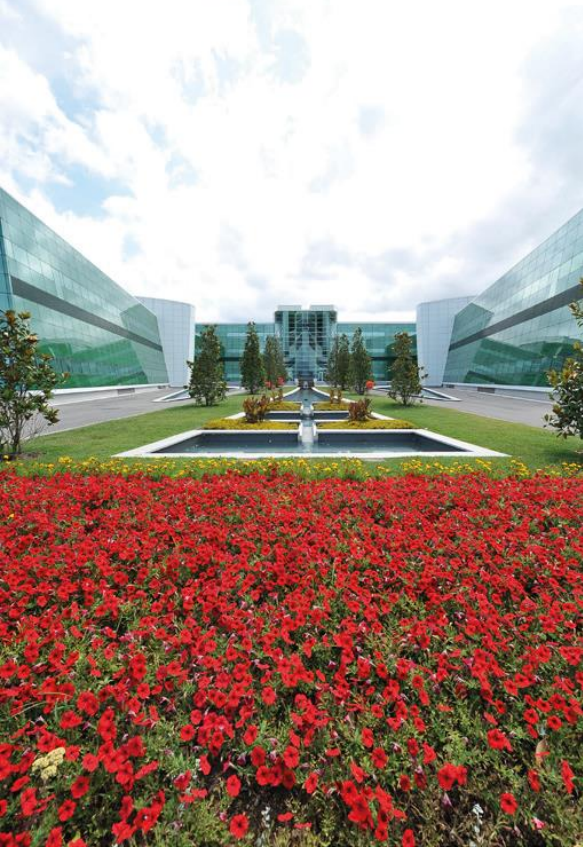
Κέντρο Έρευνας & Ανάπτυξης Pierre Fabre – Τουλούζη: Έργο του Αρχιτέκτονα Roger Taillibert