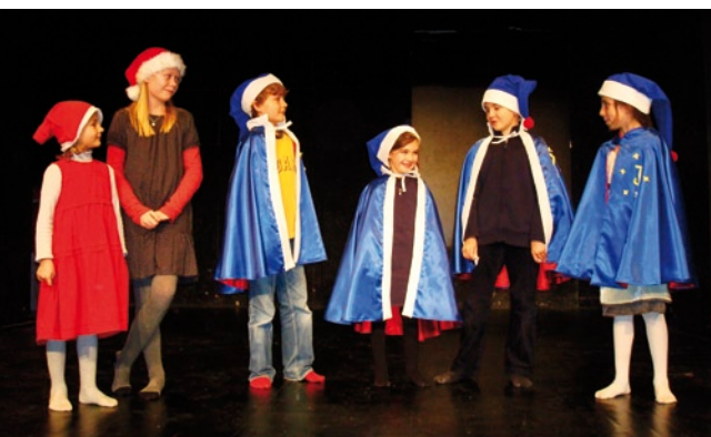
Den årlige julekomedie i primaireskolen