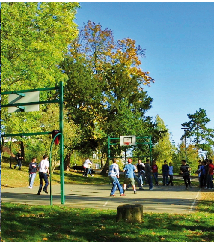
Lycée Internationals slot og park