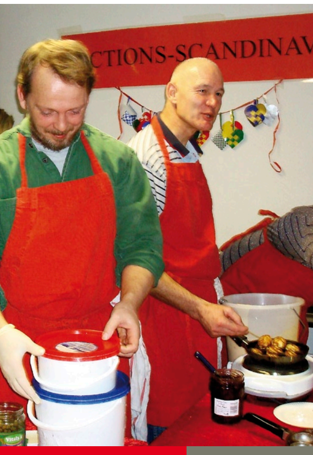
Forældre i julemadboden