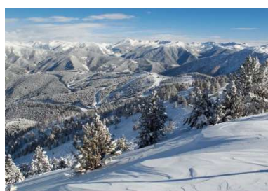
PYRÉNÉES - à 1h de Perpignan